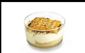
354b - Mattonella Crema al caffè e zabaione, intervallati da biscotti bagnati nel caffè 5,00€