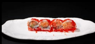
093 - Spicy sake roll 8pz

Riso, spicy salmone, cetrioli, tobiko, cipolla