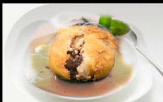
353 - Gelato fritto cioccolato Gelato fritto in pastella al cioccolato 4,50€