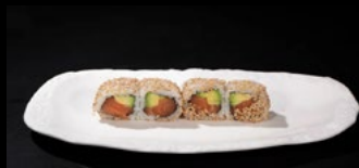
091 - Sake roll 8pz