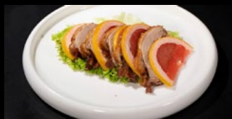
317 - Anatra all arancia