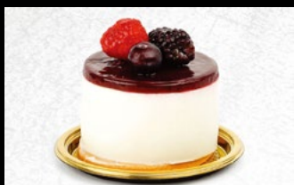
354 - Cheesecake ai frutti di bosco Crema al formaggio sormontata da biscotti sbriciolati e frutti di bosco e semi canditi 5,00€