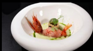
013- Tartare gambero rosso

Gambero rosso, avocado burrata, patate dolce, uova.