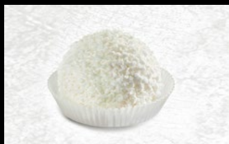
365 - Tartufo bianco

Gelato alla panna, con cuore di caffè, e granella di meringa