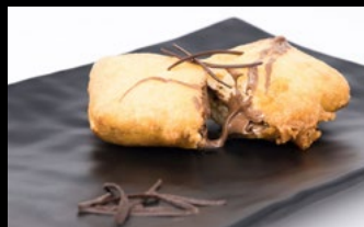
350 - Nutella frita Crepes frita con all'interno Nutella 4,50€