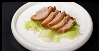
316 - Anatra arrosto