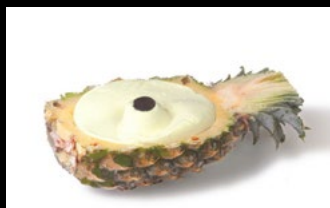
368 - Frutto ripieno di gelato al gusto ananas