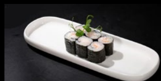
079 - Hosoebi 6pz