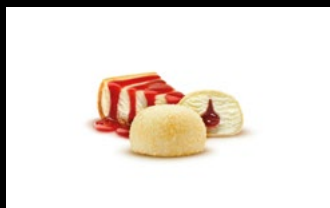
364 - Mochi cheesecake