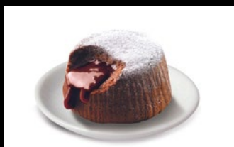
370- Soufflé al cioccolato

Tortino al cioccolato con morbida crema al cioccolato