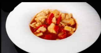
301 - Pollo gongbao