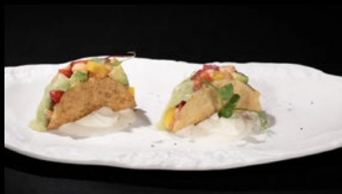
O18 - Tacos maguro 2pz

Sfoglia di ravioli, spicy tonno, cipolla, tobiko, frutta e burrata