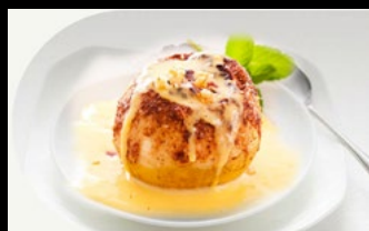
350b - Gelato fritto crema Gelato fritto in pastella alla crema 4,50€