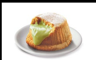
369 - Soufflé al pistacchio

Tortino al pistacchio con morbida crema al pistacchio