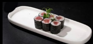
078 - Hosotonno 6pz