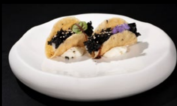
O19- Tacos tempura 2pz

Sfoglia di ravioli, gambero fritto, burrata e avocado