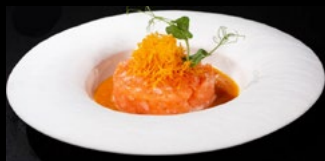
011- Tartare salmone