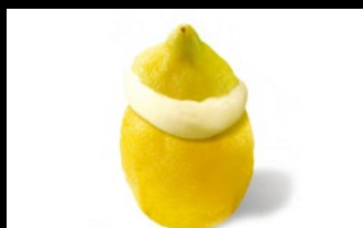
367 - Gelato ripieno al limone