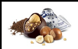
350b - Gelato dolce Bacio Un dolce gelato alla crema di gian- dua guarnito con le migliori nocciole igp direttamente dal Piemonte 5,80€