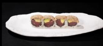
092 - Tonno roll 8pz