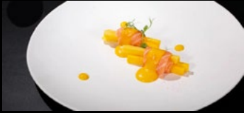
032 - Involtino mango 2pz