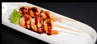
331 - Spiedini di gamberi 4pz