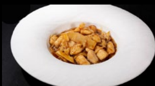
300 - Pollo alle mandorle