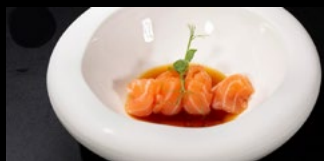
057 - Carpaccio sake 5pz