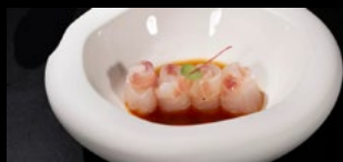
059 - Carpaccio branzino 5pz