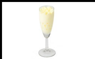
355 - Flute al limoncello Gelato al gusto di limone variegato al limoncello 4,80€