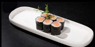
077 - Hososake 6pz