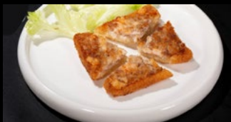
202 - Toast di gamberi con sesamo 1pz