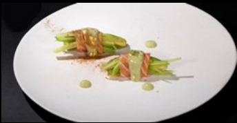
033 - Involtino avocado 2pz