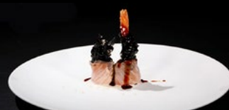
034 - Involtino tempura 2pz

Salmone scottato, gambero fritto burrata