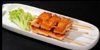
332 - Spiedini di salmone 4pz Salmone sesamo