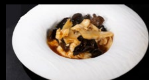
302 - Pollo con bambu e funghi