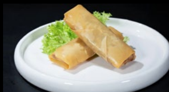
200- Involtino primavera 2pz

Involtini di primavera, farina, verdure miste.