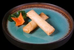
201 - Involtino di gamberi 2pz