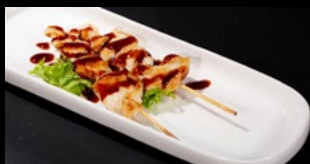
330 - Spiedini di pollo 4pz Pilo, sesamo