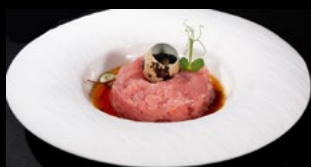
012- Tartare tonno