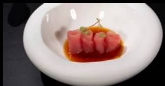
058 - Carpaccio tonno 5pz