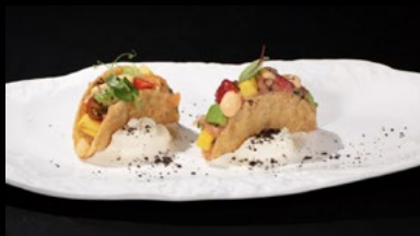
O17- Tacos salmone 2 pz

Sfoglia di ravioli, spicy salmone, cipolla, tobiko, frutta e burrata