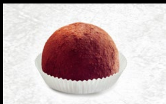
366 - Tartufo nero

Gelato al cioccolato con cuore di cre- ma, polvere di cacao e granella di noc- ciola